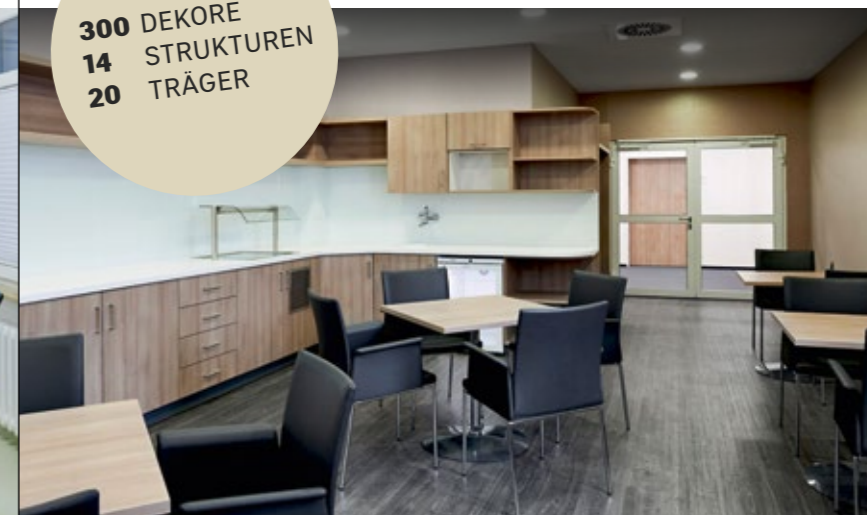
St. Marien-Hospital, Mülheim