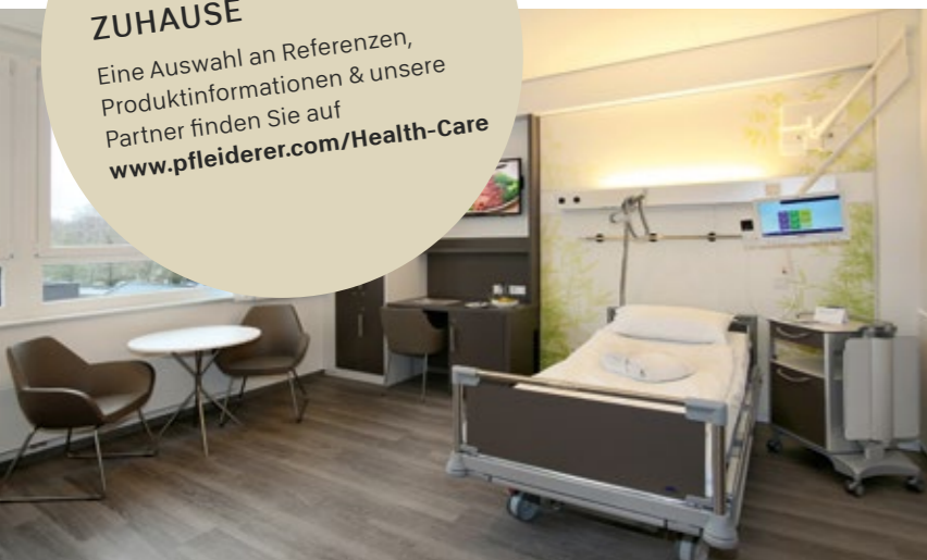
St. Franziskus-Hospital, Ahlen

Eine Auswahl an Referenzen, Produktinformationen & unsere Partner finden Sie auf www.pfleiderer.com/Health-Care